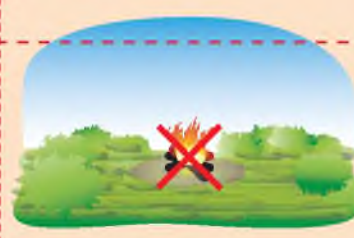
На торфяном болоте