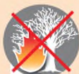
Поджигать сухое стоящее дерево