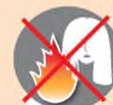
Находиться у костра с распущенными волосами