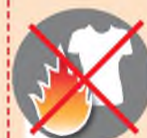
Приближаться в синтетической одежде