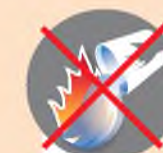
Оставлять костер непотушенным

поведения при лесном пожаре ПАМЯТКА по правилам