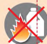
Лить в костер горючие жидкости