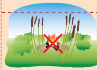
В зарослях сухого камыша